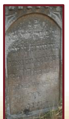
פ"נ גבר בגוריון דחיל חסאין צדיקה בסתר נתן . כל דרכיו השכלי לעסוק במו"מ באמיה | כבוד שמו כה"ר דוד בן מהו"ר שלמה משה חיים ז"ל | נפטר כ"ו סיון תרע"ה | תנצבה