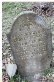
פ"נ איש תם וישר ירא ד' נחמד לבריות מ' ישראל איסר במ משה דוב ז"ל | נפטר רבקה ע"ה | בת מהר"ר שלמה משה חיים ז"ל | אשת כה"ר אהרן ז"ל | נח נפשה ביום ה' י"ב לחודש סיון | ונטמנה למחרתו ערש"ק | תש"ב לפ"ק תנצבה